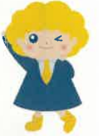
パートタイム・有期雇用労働法 キャラクター「ポちゅ」ちゃん