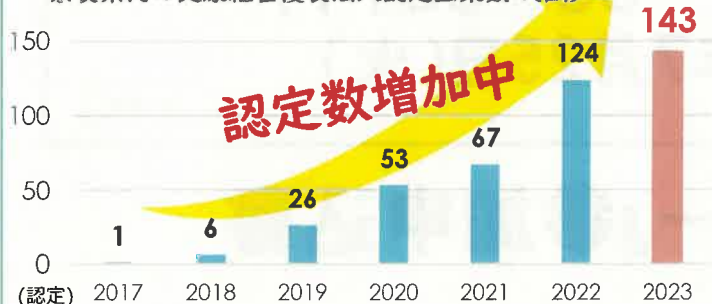
奈良県内の健康経営優良法人認定企業数の推移

セミナーでは健康経営®の取り組み事例の発表やこれから始まる「健康経営優良法人2024」認定申請を考えておられる方向けの講演があります。